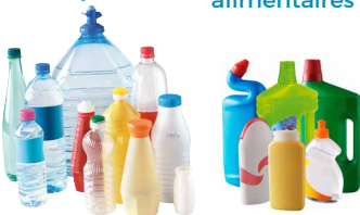
Bouteilles, bidons et flacons en plastique